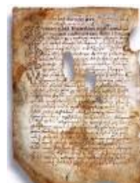
Псковская судная грамота

Двинская уставная грамота 1397 года. Мздоимство упоминается в русских летописях XIV века, например в Двинской уставной грамоте 1397 года в статье 6: «А самосуда четыре рубли, а самосуд то: кто изыснав татя с поличным, да отпустит, а себе посул возьмет, а наместники доведаются по заповеди, ино то самосуд, а опричь того самосуда нет». Там же, в статье 8: «...а черес поруку не ковати, а посула в железех не просити; а что в железех посул, то не в посул».