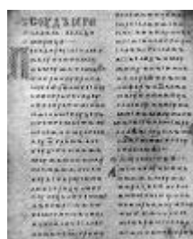
Двинская уставная грамота

Лихоимец – жадный вымогатель, взяточник».